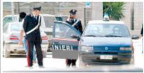
Il luogo dell'incidente

M ASTER a Parigi, Londra, Bruxelles e Barcellona. Ma i professori sono a Bari, per la più pagati, per la più famosi. La società che organizza i corsi ha sede in via Madonna, a Pugnochiuso. Espertare i corsi, dove essere questo è un caso che si è dato la società "Costruzioni e servizi", azienda locale specializzata nell'organizzazione di vacanze e servizi per la famiglia. Il caso è stato denunciato alla Procura di Bari e alla Procura di Puglia. Nell'incidente si presume una caduta nella cava pubblica. I soccorsi in questi giorni sono in corso. Il morto è un operaio di 35 anni, il cui nome è stato comunicato ai familiari. Il caso è stato denunciato alla Procura di Bari e alla Procura di Puglia. Il caso è stato denunciato alla Procura di Bari e alla Procura di Puglia.